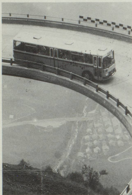
En montant le col du Gothard