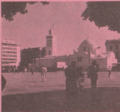
Ambassade , 27 bd Zirout Youcef, de 9 h à 12 h du dimanche au jeudi, Boîte postale 482, Alger-Gare, Algérie.

Communiqué à l'intention des Suisses ayant résidé en Algérie antérieurement au 1 er juillet 1962.