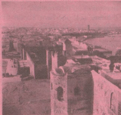
Rabat Ambassade de Suisse Boîte Postale 169 Square Condo-de-Satriano.