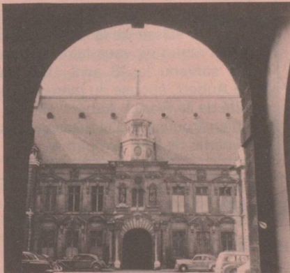
15 bis, avenue Fontaine-Argent Tél. : 80-18-83.