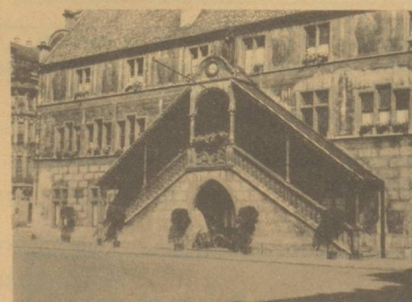
Consulat de Suisse 19 a, rue du Sauvage B. P. 1027 68050 MULHOUSE CEDEX Tél. : (89) 45-32-12