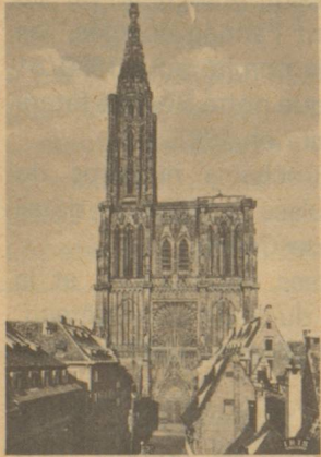
Consulat de Suisse 7, rue Schiller. Tél. : 35-15-17/18.