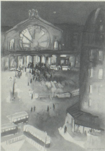
« Gare de l'Est », aquarelle, U. Wagner

J. Walter Thompson 22, avenue Matignon 75008 Paris