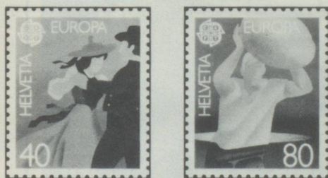
Tanzpaar Couple de danseurs Coppia di danzatori

Les PTT suisses choisirent cette année, pour la série Europa, le folklore comme motif : Un couple de danseurs, en costume folklorique, pour le timbre de 40 Cts et un lanceur de pierre, pour le timbre de 80 Cts. A la fête annuelle des bergers, à Unspunnen près d'Interlaken (Be), le moment le plus attendu du concours des lanceurs de pierre, est celui du fameux lancer de la « Pierre d'Unspunnen », d'un poids de 83,500 kg. Déjà connu au Moyen Age, c'est en 1805 que fut rendu hommage à cette coutume des bergers, et une pierre portant les dates : 1805-1905 immortalise la 1 re fête officielle et son centenaire.