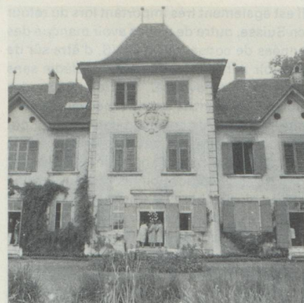
Vue du Château de Waldegg