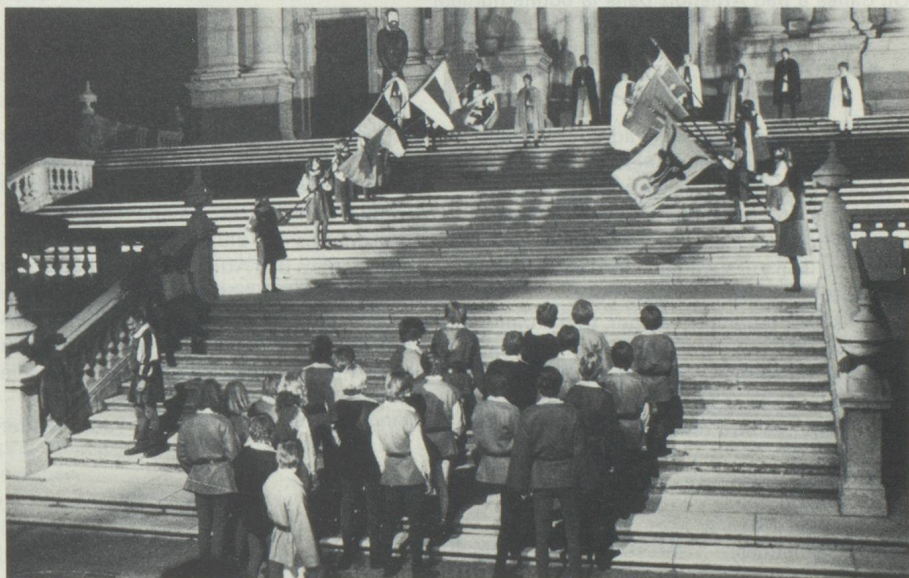
Représentation théâtrale sur le parvi de la cathédrale