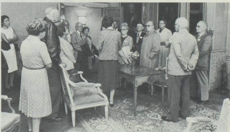
Visite du Château de Waldegg