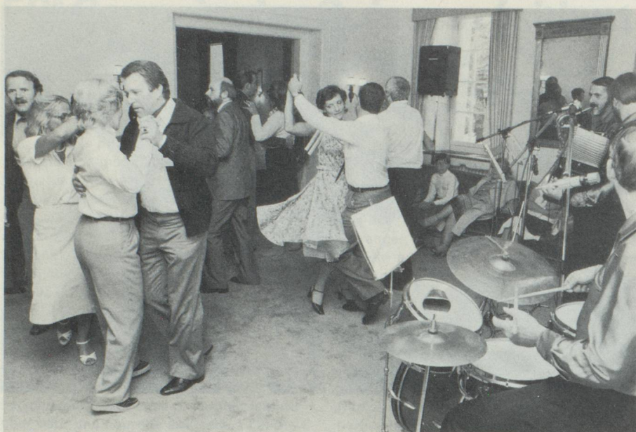
On danse à Bad Attisholz dans la bonne humeur

une question de folklore: «J'admire toujours le courage de ces personnes, qui quel que soit leur âge ou leur classe sociale, vont se construire une nouvelle existence à l'étranger et y développer une activité indépendante qu'ils n'auraient peut-être pas pensé, auparavant, pouvoir mener à bien».