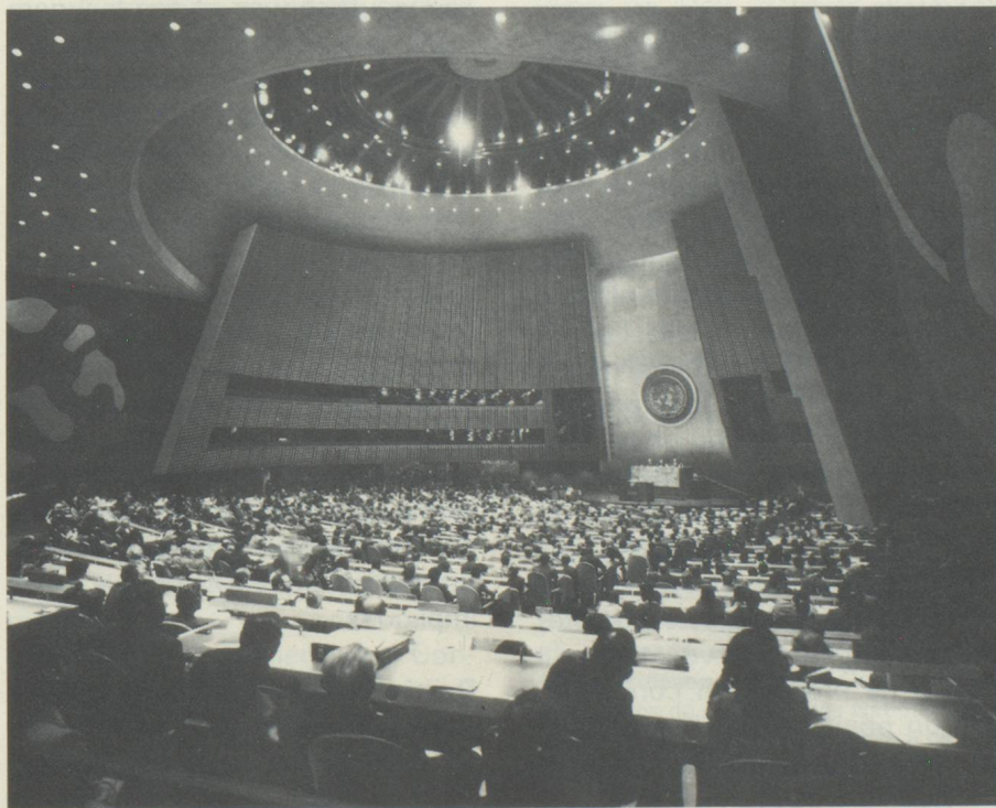
L'Assemblée plénière de l'ONU

tions établies par la Charte, ainsi que sur la politique de la Suisse à l'ONU. Selon le chapitre VII de la Charte, il incombe au Conseil de sécurité, en cas de menace contre la paix, de rupture de la paix ou d'acte d'agression, de prendre des mesures collectives contraignantes, de nature militaire ou non militaire. Une telle décision requiert l'accord des cinq membres permanents du Conseil de sécurité – Chine, France, Grande-Bretagne, Union soviétique et Etats-Unis – qui disposent chacun du droit de veto. La participation de la Suisse aux mesures militaires prévues à l'article 42 de la Charte ne saurait entrer en considération, parce qu'elle serait contraire au droit de la neutralité. Conformément à l'article 43, aucun Etat ne peut toutefois être contraint, de manière automatique, à participer à des sanctions militaires; au contraire, le Conseil de sécurité doit, dans tous les cas, conclure avec l'Etat en question un accord particulier sujet à ratification. De plus, le conseil de sécurité a le pouvoir, selon l'article 48,