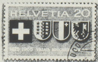
Timbre n° 432