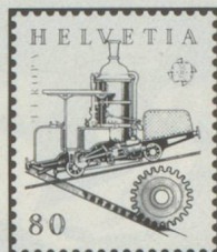
Chemin de fer à crémaillère