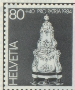
80 + 40 c. Museum Ariana, Genf Musée Ariana, Genève Museo Ariana, Ginevra