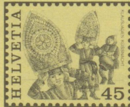
Klausjagen, Küsnacht a. R. SZ