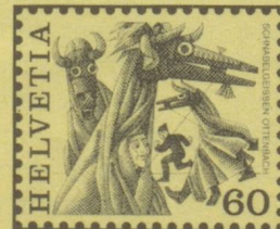
Schnabelgeissen, Ottenbach ZH