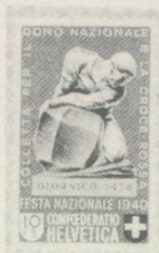
P.P. N° 4

Les Mercenaires milanais à la solde du duc de Bourgogne combattant les Suisses, en plein désaccord avec le traité de 1467 entre les Liges et le duc de Sforza, d'une part, et d'autre part le canton d'Uri qui avaient conquis la Levantine en 1439 que, par traité, Milan l'avait abandonnée. Ne voulant plus reconnaître ce traité, les Milanais le déclarèrent faux et reçurent les envoyés suisses avec insolence et mépris.