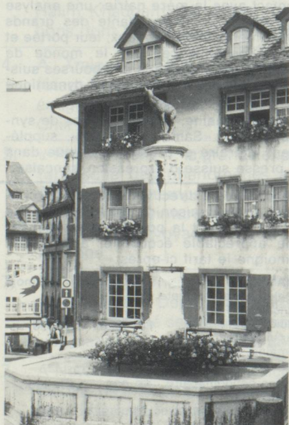
Bâle. La fontaine du chamois, l'un des attraits de la vieille ville.