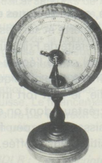
Laiton, bois, papier. H. totale : 18,5 cm ; D. du disque gradué : 11,5 cm Inscription : Balance élastique inventée par Ferdinand Berthoud.

C.N.A.M., Musée National des Techniques, Inv. N° 1355.