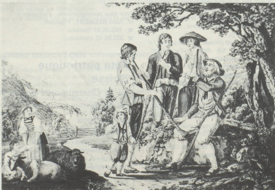
Leçon de cor des Alpes, de Georg Vollmar, début du XIX e siècle. British Museum.

Ed. 24 Heures 39, Avenue de la Gare Ch 1200 Lausanne