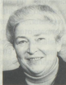
Esther Bühler Conseillère aux Etats, membre de la Commission des Suisses de l'étranger