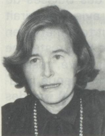
Elisabeth Kopp Conseillère fédérale