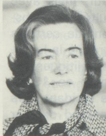
Monique Bauer Conseillère aux Etats