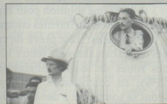
Auguste Piccard (à gauche) en 1932.

■ Il y a 25 ans décédait le professeur Auguste Piccard , un des plus grands et plus courageux chercheurs que la Suisse ait connus. Au début des années trente, ce scientifique aux talents multiples s'est envolé à une altitude jamais atteinte jusqu'alors à bord de son ballon stratosphérique.