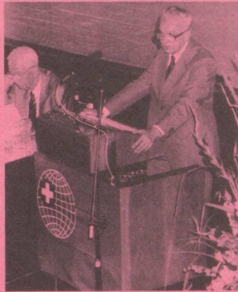
Le conseiller fédéral Léon Schlumpf, qui se retire à la fin de cette année, s'adresse aux Suisses de l'étranger.

Un autre point fort de l'assemblée plénière a été, pour tous les participants, le discours plein d'esprit et d'idées du conseiller fédéral Léon Schlumpf, qui se retire à la fin de l'année: il a souhaité une cordiale bienvenue aux personnes présentes, dans les quatre langues nationales.