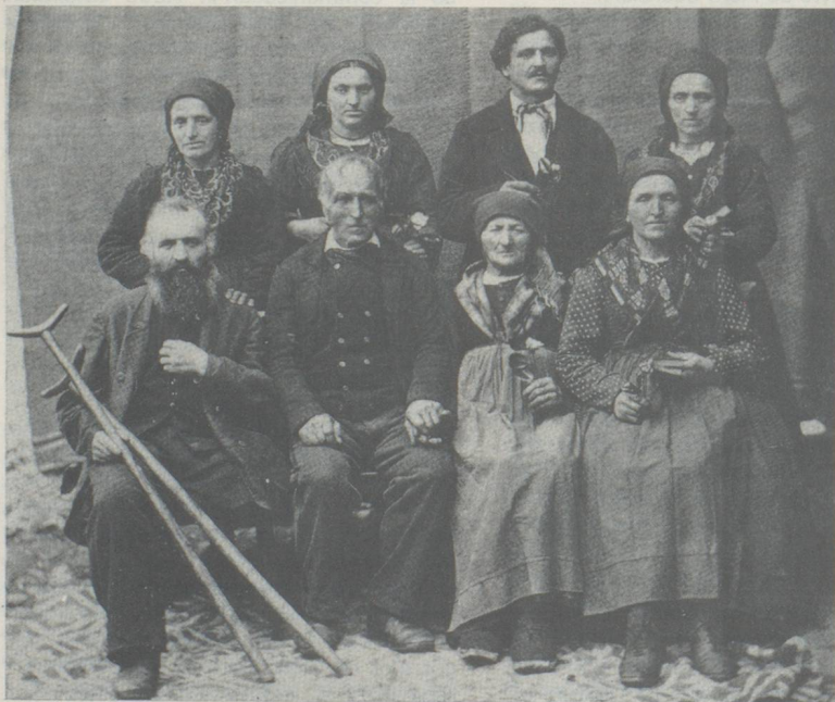
Portrait de groupe pris entre 1870 et 1900.

Ces photographes ambulants, parfois colporteurs de métiers, ne limiteront pas leur travail au seul portrait. Nombre d'entre eux semblent avoir fixé sur la plaque sensible des traits quotidiens de ces populations, de ces