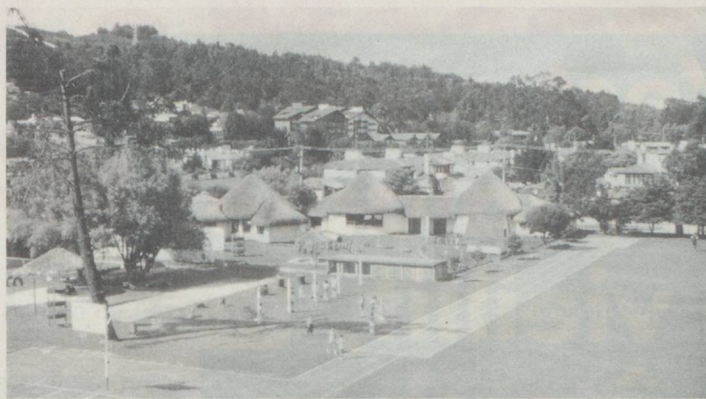
École suisse à Bogotà, Colombie, au premier plan les édifices aux toits de paille du jardin d'enfants, à l'arrière-plan l'édifice de l'école.

établir ainsi leurs prestations, en fonction du modèle donné par le plus généreux d'entre eux. A part les contributions volontaires pour des projets d'investissements extraordinaires, avant tout des constructions, cela touche tout particulièrement la mise en congé des enseignants de leur activité pour enseigner dans une école suisse, ainsi que la possibilité pour eux d'être maintenus dans la caisse de pension de leur canton.