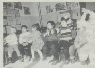
Le jardin d'enfants de l'école suisse à Catane, Italie.

FC: En ce qui concerne les formes d'encouragement, on ne trouve guère de limitations pour autant que l'élément suisse y tienne le rôle prépondérant. Il va de soi que cet enseignement doit être assuré sur une base politique et confessionnelle neutre et dans un but non lucratif. Il ressort toutefois que l'on n'a