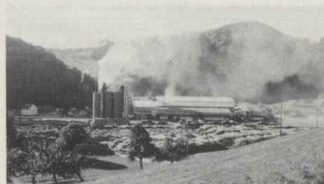
Fabrique de bois aggloméré dans la campagne lucernoise: faire respecter les prescriptions pour la pureté de l'air n'est pas chose aisée.

● Les émissions d'oxydes d'azote (NO x ) que l'on trouve dans l'atmosphère sous la forme de dioxyde d'azote, sont aujourd'hui trois fois plus élevées qu'en 1960. En Suisse, les trois quarts environ des émissions de NO x proviennent du trafic routier motorisé, donc de la combustion de carburant. Bien que les normes relatives aux gaz d'échappement rendent le catalyseur obligatoire à partir de 1987 pour les voitures neuves, ce qui a pour effet de réduire progressivement les émissions de NO x , il y aura encore, en 1995, deux fois plus d'oxydes d'azote qui s'échapperont dans notre atmosphère qu'en 1960.