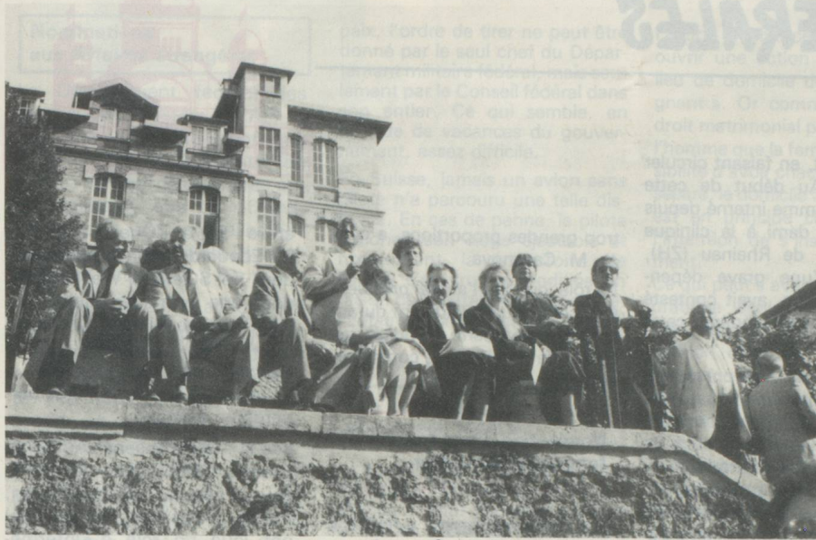
De nombreux amis étaient venus participer à cette fête !

cet instant particulier pour retracer succinctement l'histoire du Pacte Fédéral des Confédérés.