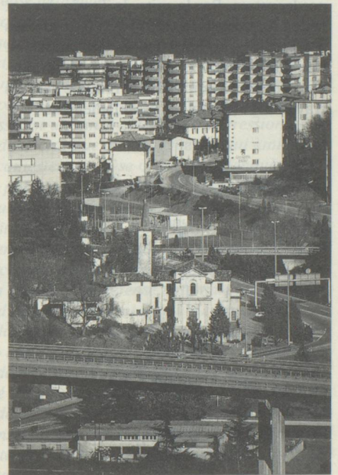
L'urbanisation du Tessin: le 76 pour cent de la population vit dans des agglomérations (Lugano; photo: Giosanna Crivelli).

L'image traditionnelle, qui évoque la petite dimension d'un canton montagnard, séparé par les Alpes et possédant une frontière au sud, justifia «le développement raté et précaire du Tessin, parce que bloqué par des in-