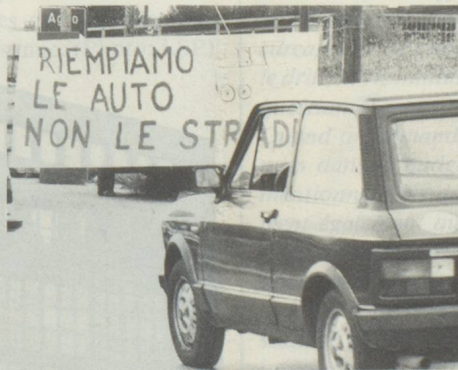
Protestation contre les pendulaires venant en voiture, dans le Malcantone: «Remplissons les voitures et non les routes.»

Ces chiffres montrent la profonde évolution de l'organisation territoriale cantonale. Le Tessin, une des régions les plus montagneuses de Suisse, est aujourd'hui parmi les plus urbanisées – le 76% de la population réside dans les quatre agglomérations de Lugano,