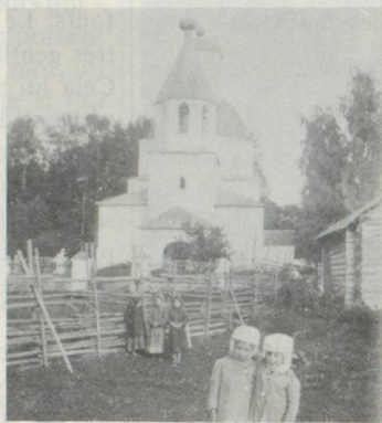
Les enfants du fromager suisse et propriétaire de domaine Emil Rieder devant l'église de Maloe Wosno (Russie) vers 1910.

D'autre part, l'histoire de l'émigration vers la Russie montre qu'il n'y avait pas seulement des gens pauvres et des aventuriers qui émigraient: les trois quarts des passeports établis dans le