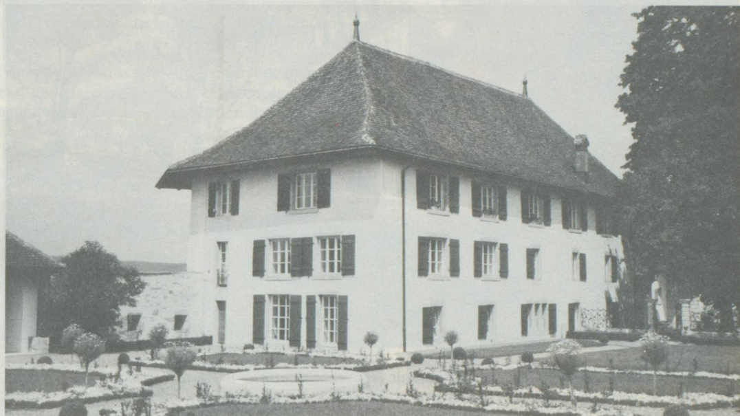
Une réalisation de la NSH: le Stapferhaus, au château de Lenzbourg.