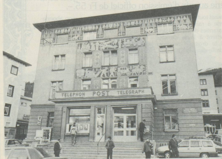
L'ancien Musée Kirchner à Davos.

une communauté d'intérêts qui s'est fixé pour but de n'offrir que des moyens de transport respectueux de l'environnement. Dans ces stations, il est notamment interdit de circuler avec des véhicules ayant un moteur à explosion; des dérogations ne sont accordées qu'à titre tout à fait exceptionnel.