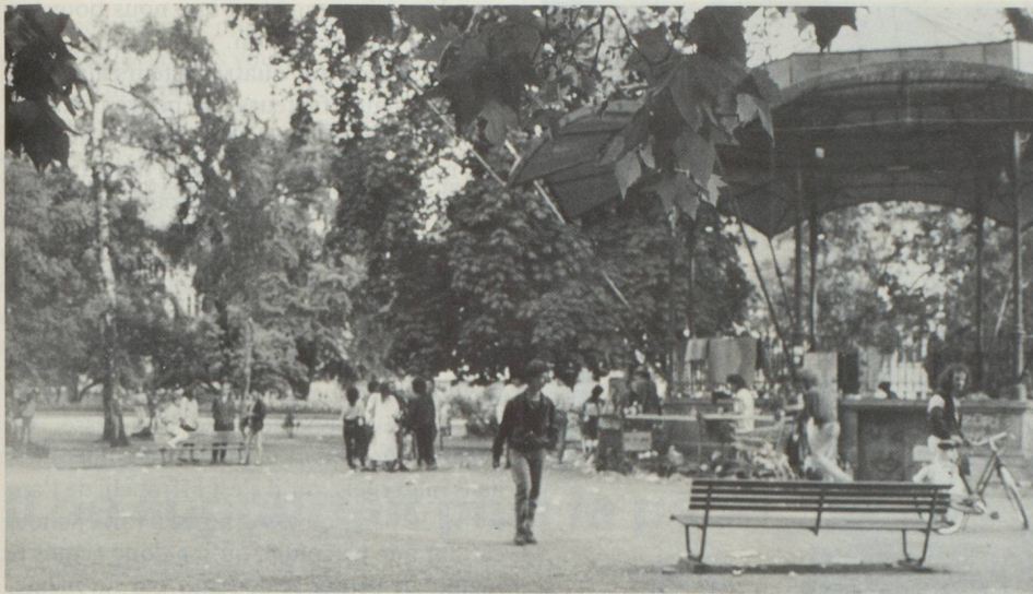
Aujourd'hui, le lieu de rencontre des drogués à Zurich est à la «Platzspitz».

Bush, et par la tendance marquée à la répression dans d'autres pays. Cela peut tenir au fait que la population suisse sensibilisée au problème est très bien informée et que les débats publics se déroulent à un haut niveau. Nombreux sont ceux qui sont conscients du fait que, dans une société libérale, des phénomènes socio-culturels tels que la consommation de drogue exigent une politique prudente.