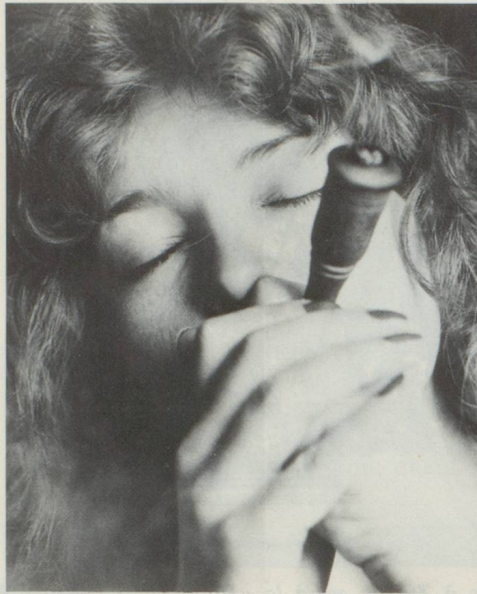
«Chilum», une sorte de pipe pour fumer le haschich.

Si l'on consomme des drogues pour rétablir l'équilibre intérieur détruit par l'ennui, les tensions, le stress ou les conflits, il faut considérer qu'il s'agit d'une tentative d'auto-