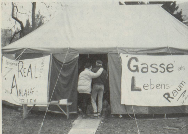
La «Kleine Schanze» à Berne: on accueille les drogués en détresse sous une tente chauffée.

3. La prévention, c'est: limiter et interdire la publicité pour les drogues. Des slogans du style «La bière, c'est la bonne humeur» ou encore «Gagnez en assurance» (publicités pour de la bière et pour une préparation pharmaceutique) ne sont que deux exemples d'une longue liste d'incitations à consommer des drogues. C'est une façon de mettre en marche le mécanisme.