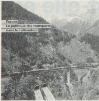
Forum: La politique des transports dans le collimateur

En sa qualité de pays de transit, la Suisse occupe une place importante. Le Gothard continue à être un maillon important sur l'axe Nord-Sud. Sur la photo: Tronçon ferroviaire du Gothard et autoroute N2.