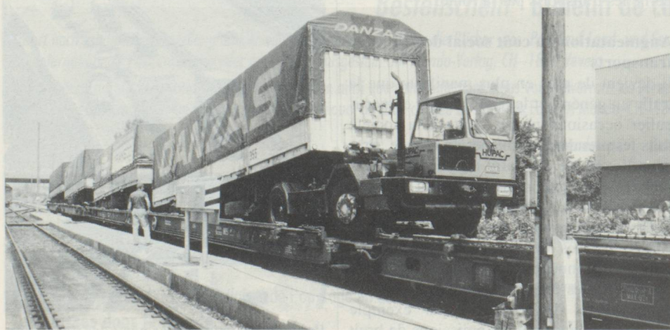
Le trafic des poids lourds dans le collimateur des critiques: le déplacement du transport des marchandises sur le rail est revendiqué pour le trafic de transit.

Cela signifie avant tout que la croissance du trafic doit connaître certaines limites; que le développement des moyens de transport doit être effectué de manière coordonnée, que les répercussions négatives du trafic doivent être réduites, que le trafic international, notamment le trafic de transit, doit être mené à