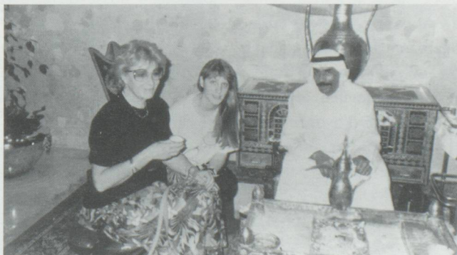
Le Cafetier et les Suissesses dégustant la "Gahwa", le café, bouilli à petit feu sur des cendres et du charbon.