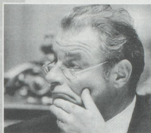
Jean-Pascal Delamuraz s'est rendu à Paris pour parler des problèmes soulevés par l'AELE.

Delamuraz, Conseiller Fédéral, était à Paris le 24 septembre dernier. Il y a rencontré le premier ministre français, Michel Rocard. Objets de l'entretien : les problèmes soulevés par la création de l'Espace Economique Européen entre l'Association Européenne de Libre Echange (AELE) et la Communauté Européenne (CE).