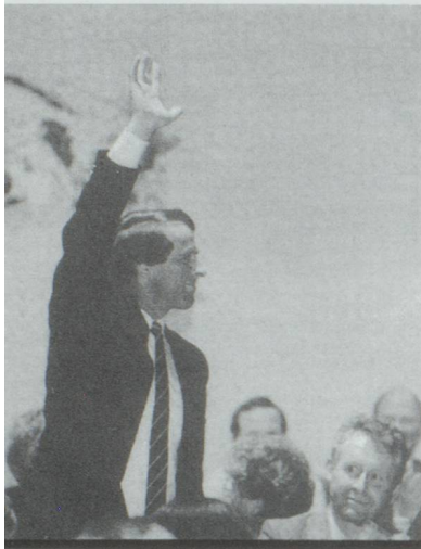
Adolf Ogi. Président de la Confédération pour 1993.

Adolf Ogi a été élu le mercredi 9 décembre 1992 Président de la Confédération* par 185 voix (Flavio Cotti avait obtenu 161 voix en 1990 et Jean-Pascal Delamuraz 201 en 1989). C'est la 20ème fois qu'un Bernois accède à la présidence. Et la neuvième qu'un représentant de l'UDC (autrefois PAB) est élu président. Adolf Ogi est membre du Conseil Fédéral depuis 1987, date à laquelle il avait été élu en remplacement de Léon Schlumpf. Son ascension politique est fulgurante, à tel point que certains lui reprocheront de n'être pas passé par un "apprentissage" dans un Exécutif communal ou cantonal. En 1978, il adhère à l'Union Démocratique du Centre (UDC), en pleine rénovation, dont il devient vite un des symboles d'ouverture. Un an plus tard, il entre