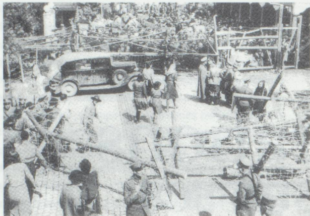
LA RÉHABILITATION DE PAUL GRÜNINGER VIENT RAPPELER UN ÉPISODE DOULOUREUX DE L'HISTOIRE SUISSE. IMAGE : LE POSTE DE FRONTIÈRES AUTRICHIEN/SUISSE À ST MARGARETHEN (SG).