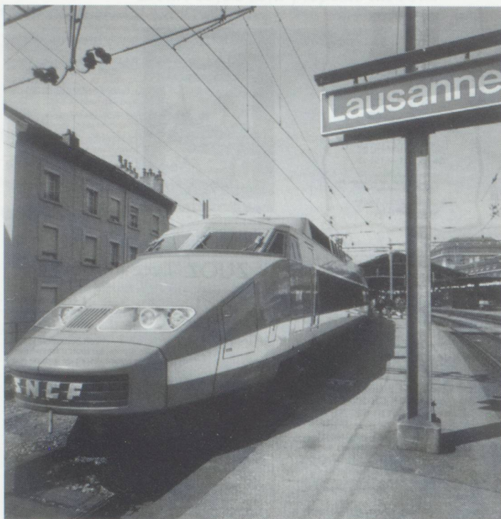
Le TGV à la gare de Lausanne

Après des mois de silence, le dossier de la relation en T.G.V. France-Suisse réapparaît. Bernard Bosson, le ministre français des Transports, Adolf Ogi, chef du DFTCE (Département Fédéral des Transports, des Communications et de l'Énergie) et les Genevois se sont mis d'accord pour étudier conjointement les lignes Chambéry-Genève, Mâcon-Genève et le raccordement de Lausanne. Un groupe de travail franco-suisse, inactif depuis des mois, va reprendre du service et il devra étudier le raccordement de Genève au projet Lyon-Turin (liaison Chambéry-Genève), en préservant la compatibilité avec une liaison Mâcon-Genève, réalisable par étape; le raccordement de Lausanne en tenant compte du futur T.G.V. Rhin-Rhône; le raccordement de Bâle et de Zurich au T.G.V. Est. La liaison Chambéry-Genève est devisée, globalement, à 10 milliards de FF, dont 6 milliards pour Genève-Anancy. La Suisse et la France pourraient financer de moitié ce dernier tronçon. Côté