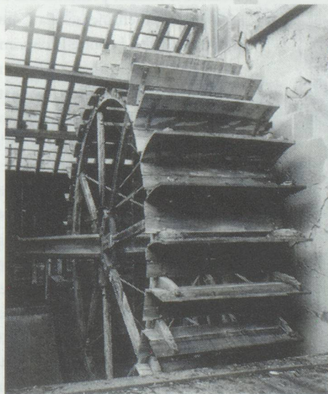
Roue hydraulique de la première fabrique Suchard.

* Le Val de Travers était riche en minerai et les plus importantes d'entre elles, les mines d'asphalte de la Presta, furent exploitées trois siècles durant, de 1712 à 1986. L'asphalte extrait fut exporté aux quatre coins du monde. On peut encore visiter ces mines aujourd'hui (Renseignements : Mines d'asphalte. Société de la Presta. CH-2105 Travers Tel. 19 41 38 63 30 10).