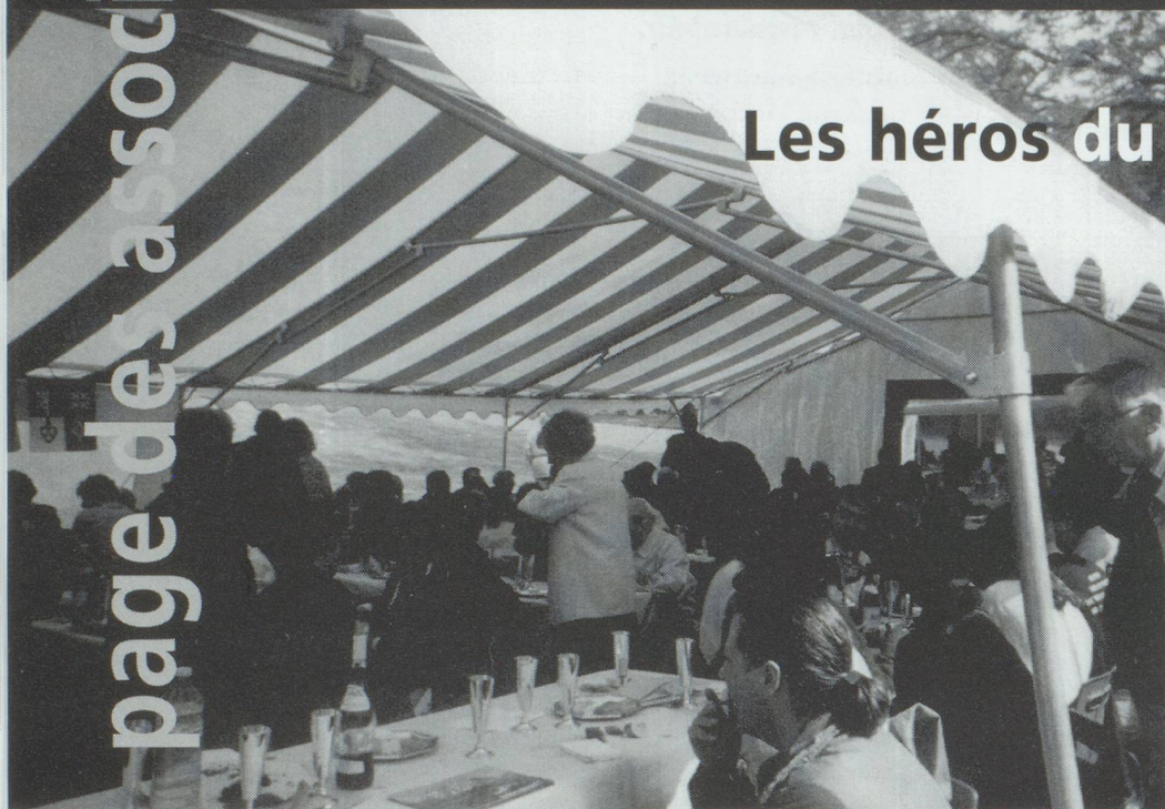
Ambiance sous le chapiteau.