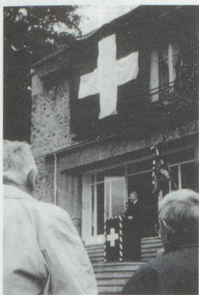
M. l'Ambassadeur Edouard Brunner lors de son allocution.