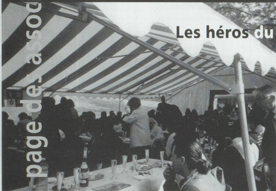
Ambiance sous le chapiteau.