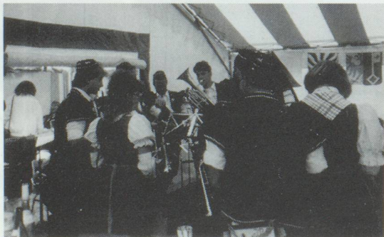
La fanfare groyérienne du Pont-qui-Branle.

En ce jour de Jeûne Fédéral, les Helvètes parisiens crurent revenue l'époque des tickets de ravitaillement et du colis suisse de la rue des Messageries. Ils se ruèrent comme à Sempach sur les brochettes du traiteur qui ne put les inciter à partager sagement la soupe comme le firent leurs ancêtres .... «Quel est ce mur de gamelles?» disait François I er au Chevalier Bayard. «Sire, ce sont les Suisses». Mais la bousculade passée, on savoura ce qui était peut-être un menu trop long tout en profitant de la dégustation offerte de vins et de fromages suisses. Il y avait des stands avec une abondante documentation: Office National Suisse du Tourisme, Radio Suisse Internationale (deux envoyés spéciaux de Berne), Chambre de Commerce Suisse en France, Hôpital Suisse de Paris, Maison Suisse de Retraite, Société Helvétique de Bienfaisance, Ecole internationale suisse de langues (CCS),