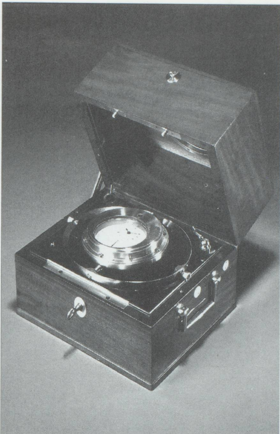
Chronomètre de marine à deux barillets, réalisé dans une boîte étanche et monté sur cardans dans un coffret d'acajou. Modèle acheté par le Ministère de la Marine française entre 1827 et 1831.

La société d'aviation Louis Breguet a fusionné en 1971 avec la Générale Aéronautique Marcel Dassault, pour former Avions Marcel Dassault-Breguet Aviation. ✦