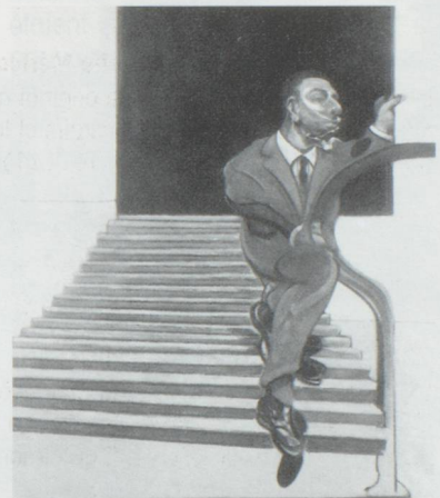
Francis Bacon est exposé au Musée des Beaux-Arts de Lausanne

Antonio Girbes, photographies. Jusqu'au 30 janvier, du mardi au vendredi de 15h à 19h, le samedi de 10h à 12h et de 15h à 19h.