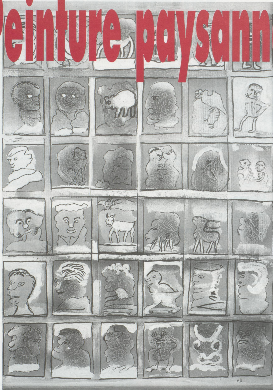
Hans Krüsi - Personnages et animaux, vers 1983.

Le Museum im Lagerhaus de Saint-Gall vient de consacrer une grande exposition à l'art paysan. Pas moins de 150 oeuvres ont été présentées au public : poyas, portraits, paysages ou sculptures ont démontré la richesse et la complexité d'un genre que l'on croit trop souvent convenu.