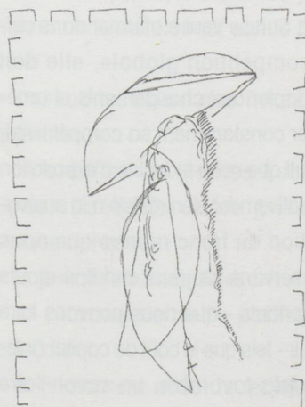
— Bedehring 15 Seidhering für EA —

Cabinet numismatique, jusqu'au 31 août 199