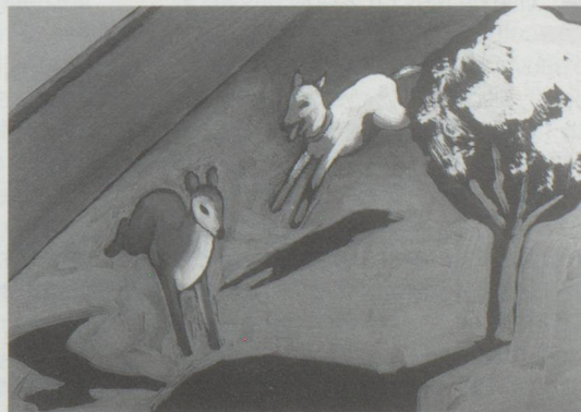
L'année du daim de G. Schwizgebel, utilise la technique de l'acrylique sur cellulose