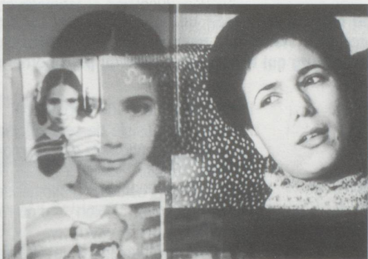
Babylon 2 de Samir Schweiz (1993)

Le film documentaire, c'est une tradition helvétique. Classique ou expérimental, il occupe une place prépondérante dans la production cinématographique suisse. Nombreux sont les réalisateurs de fictions ayant contribué à la richesse du genre. Cela tient tant à la culture qu'au cadre légal qui a longtemps favorisé cette forme d'expression. En 1963, une loi fédérale prévoyait de soutenir le documentaire (et non la fiction).