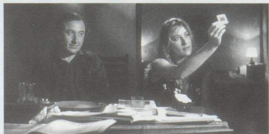
Le livre de cristal de Patricia Plattner (1994)