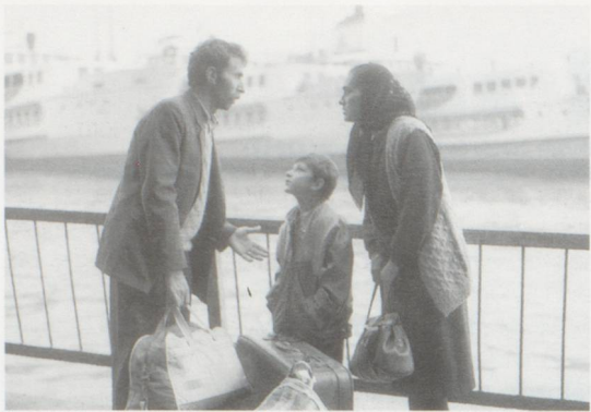
Voyage vers l'espoir de Xavier Koller (1990)