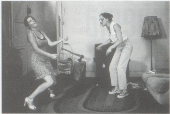
Fourbi d'Alain Tanner (1995)