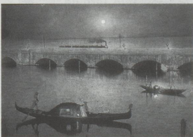
Venise, Pont de la Libertà

Né au Tessin, certainement entre 1822 et 1824, cet amateur d'images après huit ans de vie parisienne, s'installe à Venise comme opticien et photographe. Dès 1854, Carlo Ponti photographie la célèbre ville d'eau, Venise. Et, c'est un catalogue de 160 clichés qui sera présenté en 1855 à l'Exposition universelle de Paris. Artiste mais aussi technicien, il met au point en 1860, l'Aletoscopio, visionneuse pour image photographique de grand format. Puis, en 1862 il fabrique le Megalestoscopio, version agrandie du premier appareil, pour lequel il obtient le Grand Prix à l'Exposition internationale de Londres. En 1866, Carlo Ponti devient le photographe officiel de Sa Majesté Victor Emmanuel II alors à la tête du royaume de Sardaigne et couronné roi d'Italie le 27 avril 1861. Le photographe meurt à Venise le 16 novembre 1869, complètement aveugle, sans jamais avoir renoncé à sa qualité de citoyen suisse.