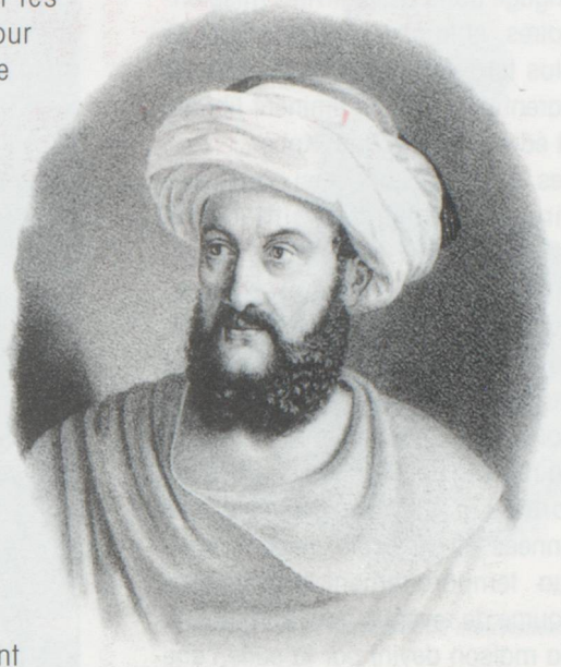
Johann Ludwig Burckhardt.