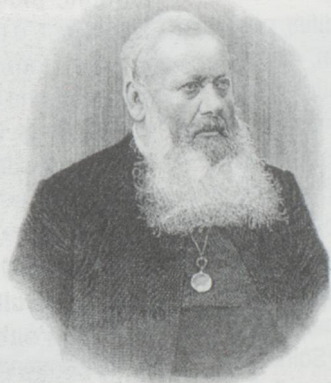
Samuel Gobat, évêque de Jérusalem.