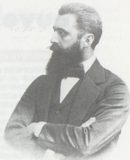
Theodor Herzl, fondateur du mouvement sioniste.