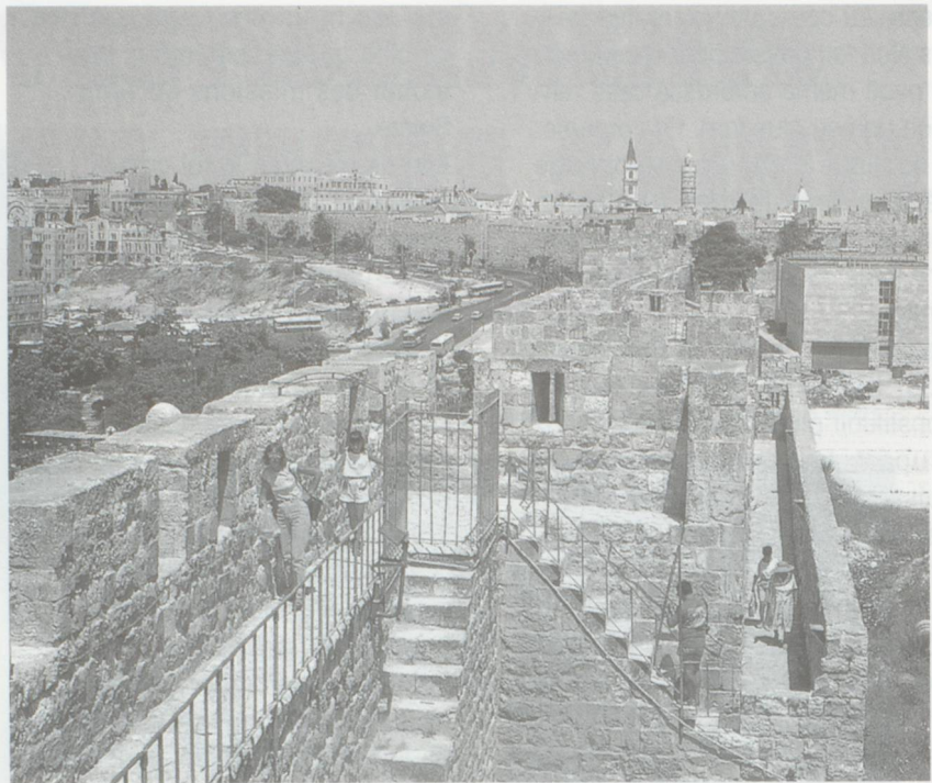
Les murailles de la Vieille Ville ont été construites par Soliman le Magnifique au XVI e siècle.

Bien que largement tombée dans l'oubli à l'heure actuelle, la contribution de Frutiger au développement économique de la Terre Sainte n'en reste pas moins éminente. Il a ainsi participé au lancement et au financement de la première voie