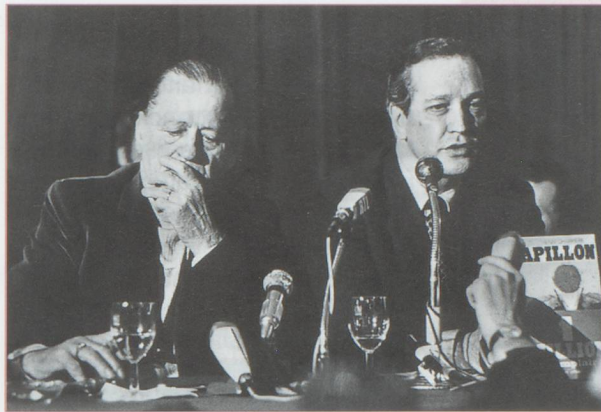
Robert Laffont avec Henri Charrière, auteur du best-seller « Papillon », en 1970.