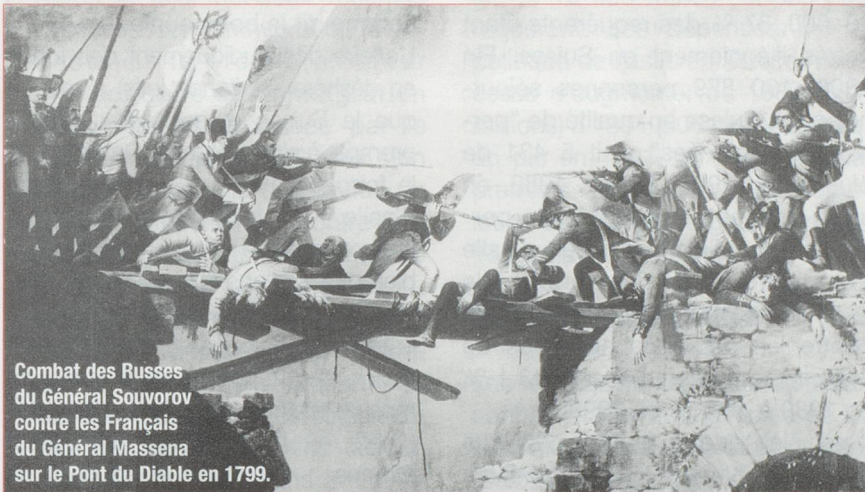
Combat des Russes du Général Souvorov contre les Français du Général Masséna sur le Pont du Diable en 1799.

Article tiré de «LA LOUPE», le magazine des amis des timbres, paru en mars 1997. Éditeur La Poste Suisse.