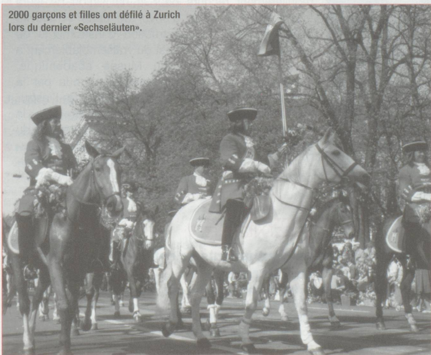
2000 garçons et filles ont défilé à Zurich lors du dernier «Sechseläuten».

Le «Sechseläuten», fête de printemps de la ville de Zurich, a commencé par le traditionnel cortège des enfants dans la vieille ville. Près de 2000 garçons et filles costumés ont défilé dans un vent presque hivernal et devant un public nombreux. Le lendemain, le «Böögg» ou bonhomme hiver a été brûlé selon la tradition, pour marquer la fin de l'hiver. Les bambins avaient revêtu leurs costumes historiques : gentilhommes, ménestrels et patriciens. L'hôte officiel du «Sechseläuten» 1997 était le canton de Thurgovie.