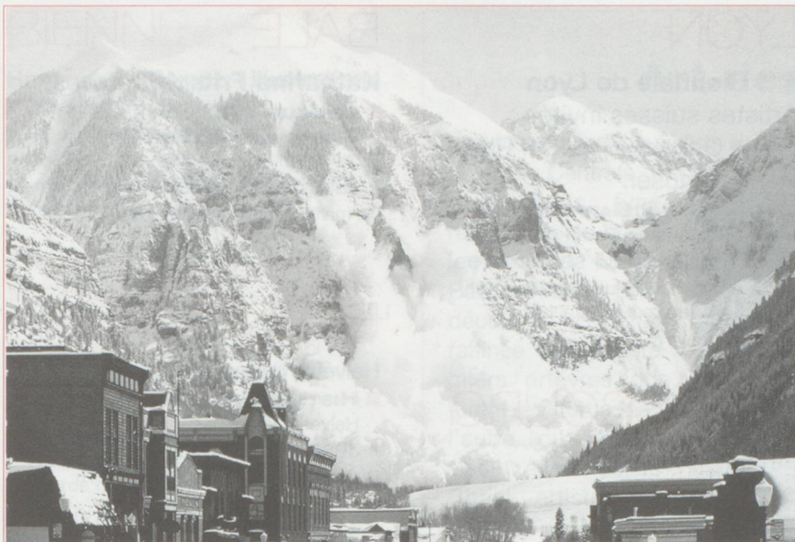
Le Centre alpin universitaire pour les dangers naturels permettra de mieux prévoir les catastrophes.