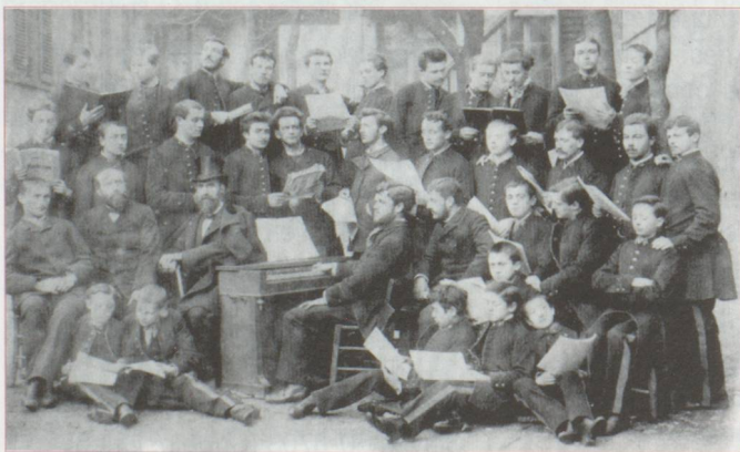
L'École Niedermeyer, vers 1885