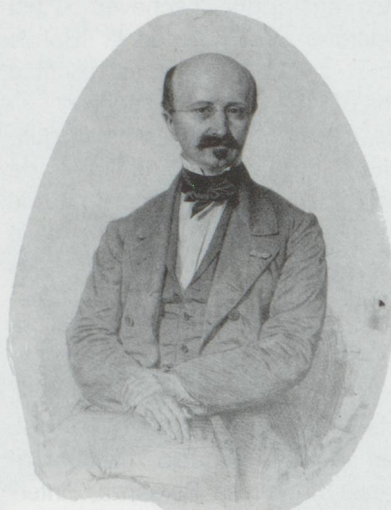
Portrait de Louis Niedermeyer, crayon.