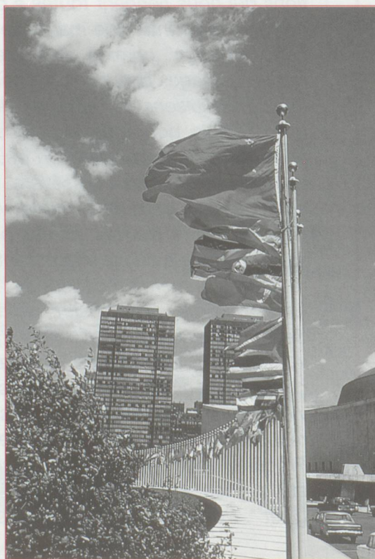
Le débat sur l'adhésion de la Suisse à l'ONU est relancé. Le vote à l'unanimité de l'Assemblée générale d'une résolution sur la neutralité permanente du Turkménistan rend obsolète la principale objection avancée par le peuple et les cantons en 1986. Les socialistes projettent le lancement prochain d'une initiative.

L'industrie militaire suisse est en voie de restructuration : pour pouvoir s'adapter au marché, les quatre entreprises fédérales d'armement devraient être partiellement privatisées et