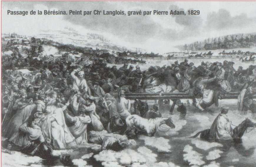
Passage de la Bérésina. Peint par Ch r Langlois, gravé par Pierre Adam, 1829

31 ans, Jomini est le plus jeune des généraux nommés depuis l'Empire. Berthier s'oppose farouchement à ce qu'il devienne général de division. Vexé, Jomini revient à ses écritures. En 1812, c'est la campagne de Russie. L'alliance est renversée. Napoléon exige que ce stratège unique en son genre reprenne du service. On lui assure qu'il ne sera pas en contact direct avec les Russes. Lors de la retraite, c'est lui qui indique à Napoléon le passage le plus favorable de la Bérésina, pour sauver ce qui reste de la Grande Armée. Avec Eblé et les pontonniers tessinois il fait des miracles. Tombé dans les eaux glacées, il ne doit la vie qu'à un soldat