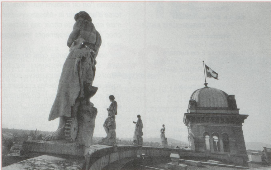
Le Conseil fédéral a fixé les dates des votations de 1998 aux 15 mars, 7 juin, 27 septembre et 29 novembre.

Une pétition signée par 1682 communes a été remise aux Chambres. Elles réclament un coin de Constitution bien à elles.