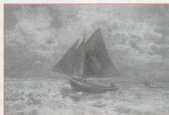
Le Bateau Rouge Odilon Redon, 1906-07.

Villa Flora, Stadthausstrasse 6, CH6400 Winterthur - Tél. : 00 41 52 212 99 66 Heures d'ouverture : du mardi au samedi de 15 h à 17 h, le dimanche de 11h à 15h.