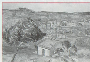
La Plaine Provençale Paul Cézanne, 1886-90.