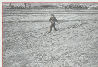
Le Semeur Vincent Van Gogh, 1888.